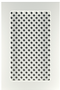
Φ100.В Фасад под решетку