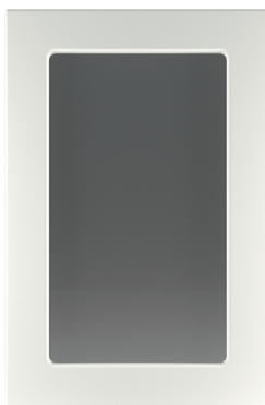
Φ100.В Фасад под стекло