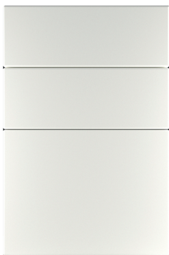
Φ100.Я Накладка на ящик