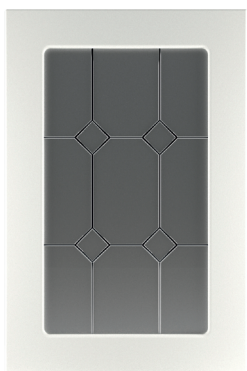
Φ100.В Фасад под витраж